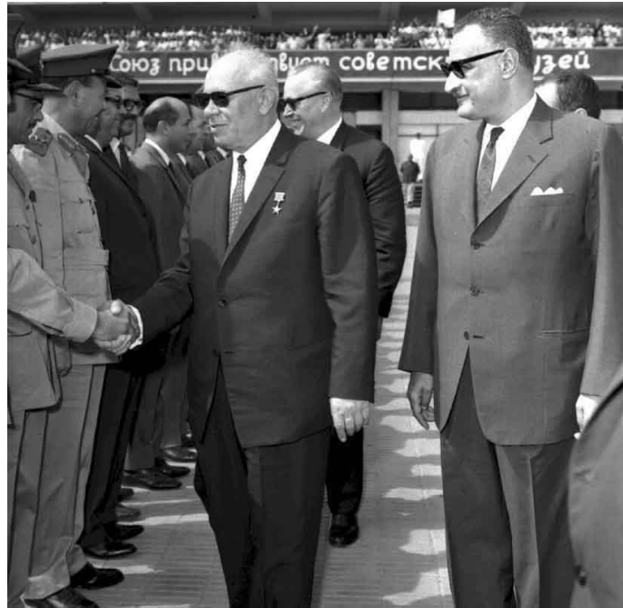
عبد الناصر يستقبل رئيس الاتحاد السوفيتي نيكولاي بادجورني ٢١/٦/١٩٦٧

فأنا من جانبي مستعد لأي خطوة في هذا الاتجاه (١) .